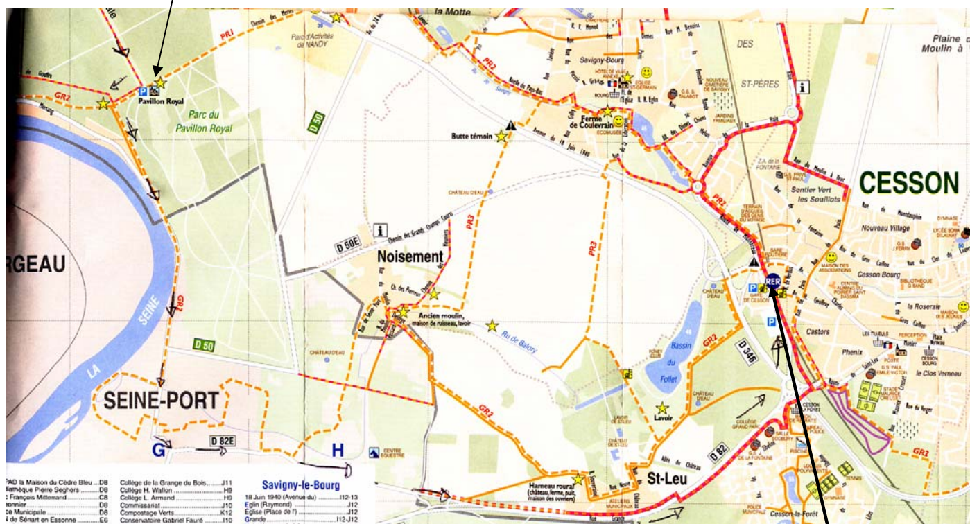
GARE RER D CESSON